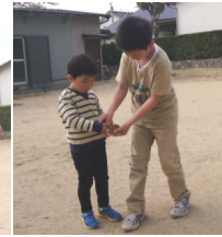
初めて来た子にコマを教える指導員