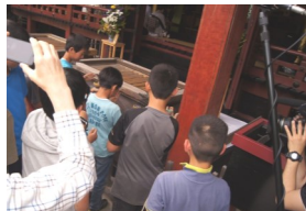
回しながら天満宮様に参拝している様子