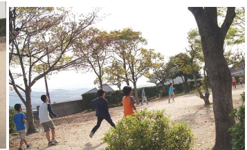
ボール遊びなどいろいろな遊びをしています。