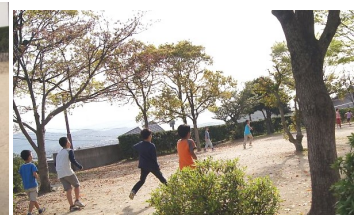
ボール遊びなどいろいろな遊びをしています。